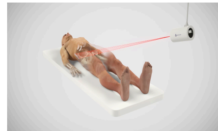
Ortoma Guide™ med ett IR-baserat enkamerasytem