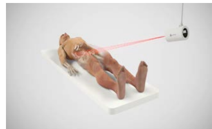
Ortoma Guide™ med ett IR-baserat enkamerasystem